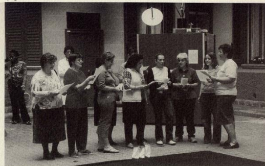
Il coro delle donne del condominio "il Cairo" canta "Bella Ciao"

Tutte le pubblicazioni prodotte sono state presentate in italiano, inglese, francese, spagnolo e arabo.